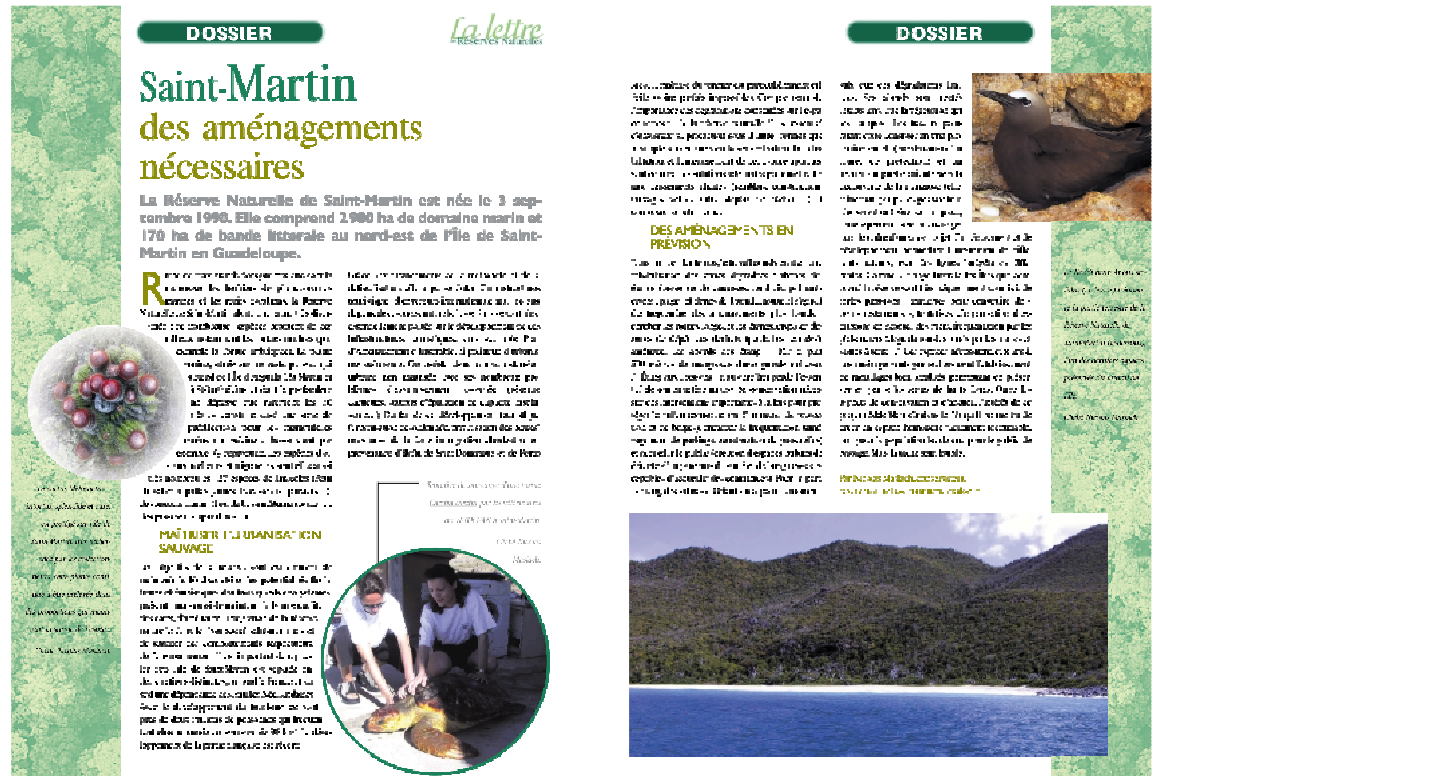
Figure 74 : Diffusion des missions et actions de la Réserve Naturelle et son patrimoine. Lettre des Réserves Naturelles