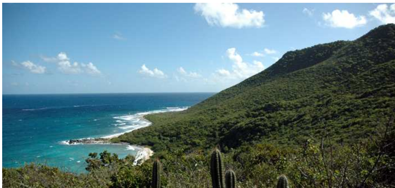
Figure 69 : Red Rock.

Selon les résultats de l'étude de faisabilité, le gestionnaire devra proposer un statut de réglementaire de protection puis mettre en œuvre les moyens nécessaires à l'intégration de ces nouveaux milieux dans la Réserve Naturelle.