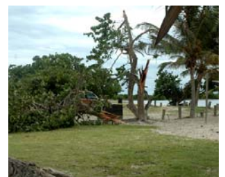
Dommmages limités dans la RNN lors du passage du cyclone Omar