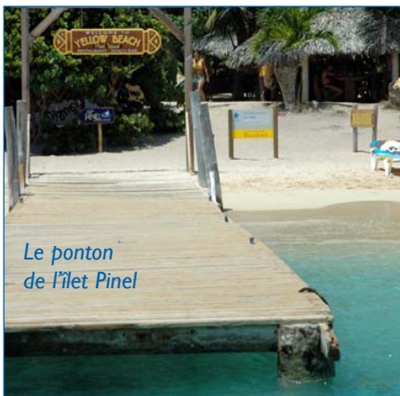
Le ponton de l'îlet Pinel

Par ailleurs, la RNN devient gestionnaire du ponton sur lequel accoste les barques des passeurs, et sur lequel débarquent les passagers. Ce ponton, en piteux état aujourd'hui, va être rénové par la Réserve, qui y consacrera un budget de 10.000 euros. ■