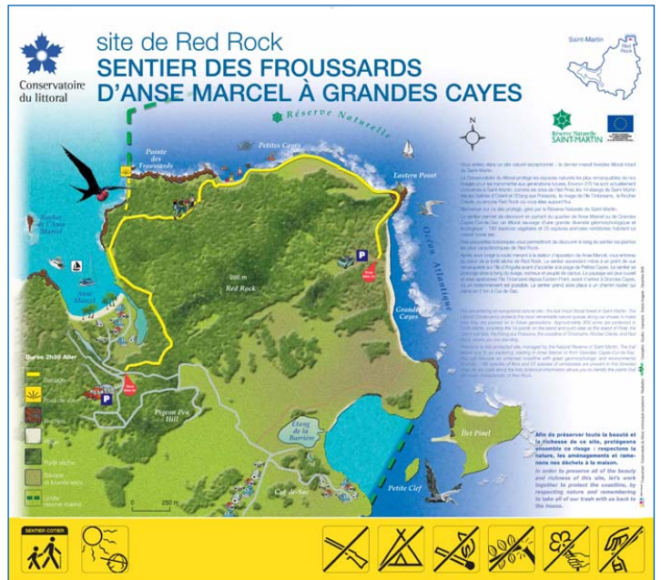
Ce panneau sera apposé aux deux extrémités du "Sentier des Froussards"

Dans le cadre de PAMPA, chaque gestionnaire a pour mission, entre autres, de surveiller l'évolution des herbiers et des coraux, d'assurer un suivi des poissons en procédant à des enquêtes de fréquentation, à l'intérieur et à l'extérieur de sa Réserve, et de transmettre ces données aux scientifiques en charge du projet. ■