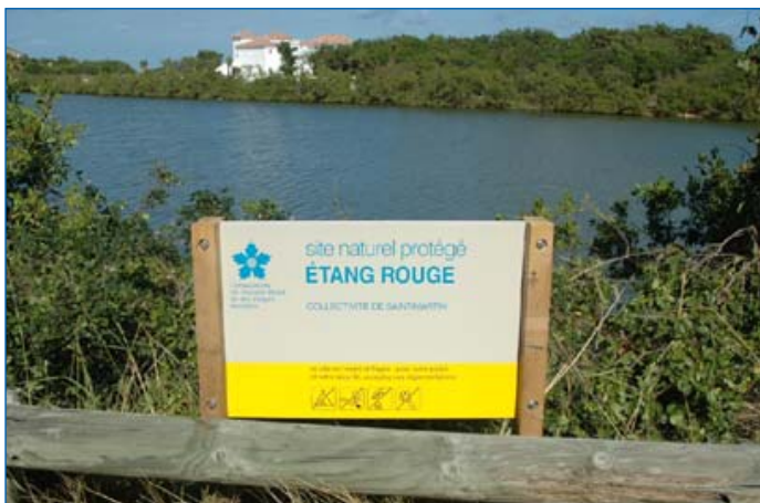
Ce panneau posé en bordure de l'étang Rouge, aux Terres Basses, rappelle que tous les étangs de l'île appartiennent aujourd'hui au Conservatoire du Littoral (sauf l'étang de Galisbay, jugé trop dégradé), qui veille à leur préservation