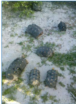
Sept tortues charbonnières ont été débarquées à Tintamare

Sept tortues charbonnières ont été lâchées dans la Réserve Naturelle, sur la plage de baie Blanche, à Tintamare. Pensionnaires d'un jardin de Sandy Ground depuis 1994, elles ont recouvré la liberté après que leur propriétaire a souhaité leur donner davantage d'espace et en a informé la RNN. Dans la mesure où ces sept spécimens sont tous mâles et où il existe une population de ces tortues terrestres à Tintamare -largement pillée d'ailleurs par des personnes inconscientes de l'atteinte qu'elles infligent à l'environnement- la RNN a pris la décision de prendre en charge ces reptiles. Rendez-vous a été fixé dans le chenal de Sandy Ground pour embarquer les animaux à bord du bateau de la Réserve et mettre le cap sur Tintamare. Apparemment victimes du mal de mer, les tortues devaient être soulagées de mettre patte à terre : elles ont juste posé une minute pour la photo avant de partir s'aventurer dans la nature.